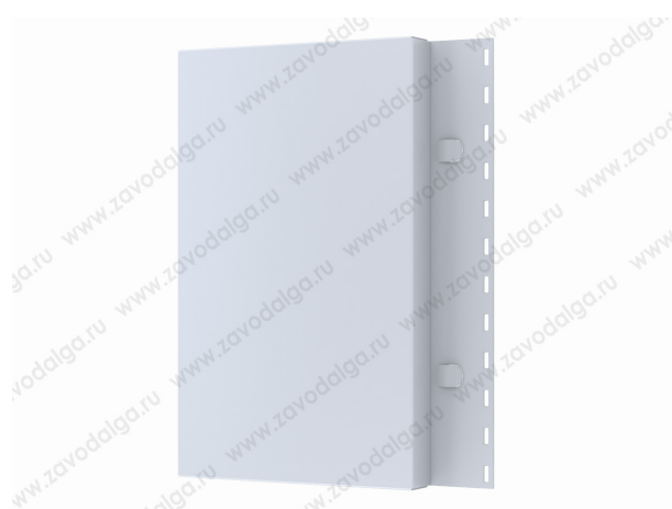
Кассета ИРЕМЕЛЬ 4