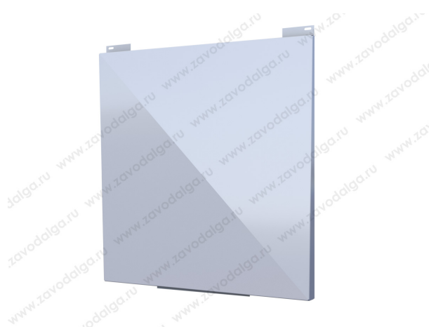
Кассета ALGA RIFEY