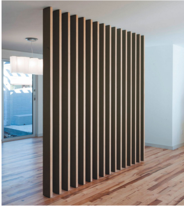
Вид - F