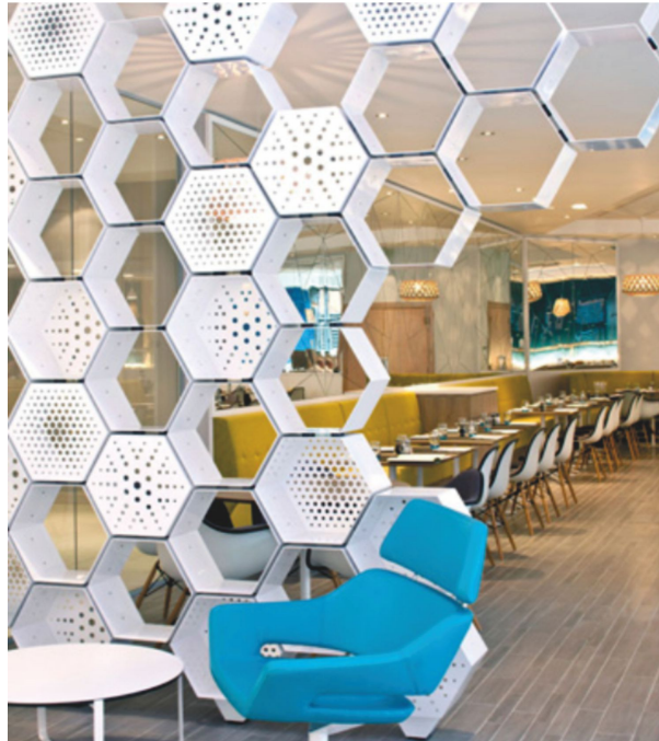
Вид - D