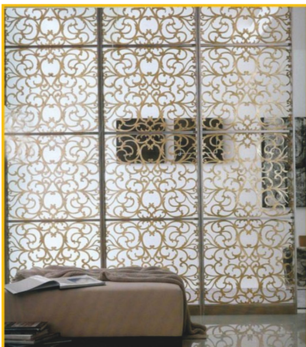
Вид - А

При их производстве используется множество отделочных материалов с различными видами покрытий, позволяющих использовать их как в местах массового скопления людей, где на первое место выдвигаются требования долговечности и износостойкости, так и при создании интерьеров кабинетов требующих простора и спокойного дизайна. Разнообразные варианты конфигурации секции, модулей и применяемых облицовочных материалов позволяют придать им уникальный и неповторимый вид. Установка элементов освещения непосредственно в перегородку является стильным и функциональным решением и позволяет дизайнерам реализовывать идею целостности интерьера.