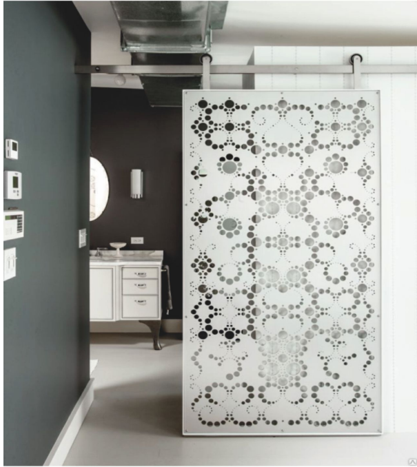
Вид - В