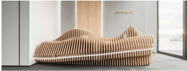
Вид - G