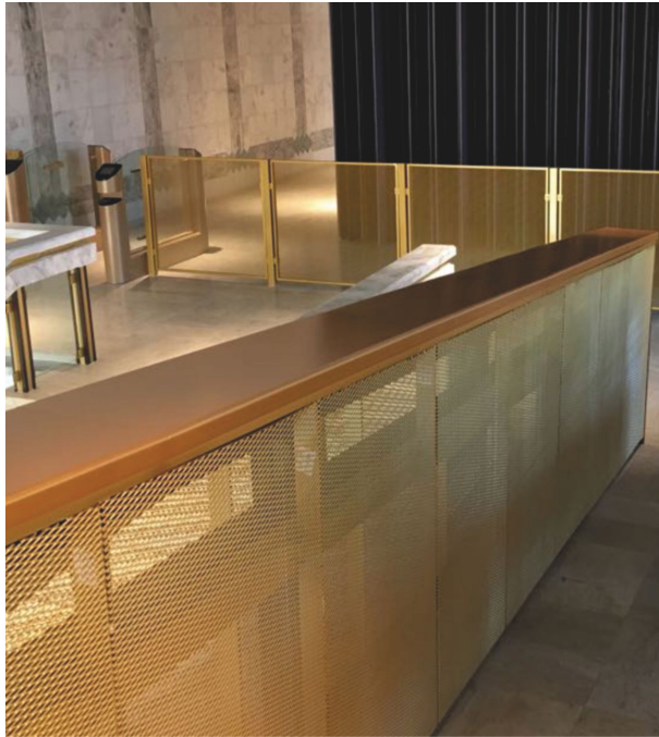
Вид - С