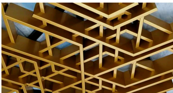
Общий вид системы ALGA WEB ALFA

Система многоуровневых модулей (островных элементов), каждый из которых может интегрироваться в другие элементы системы.